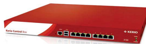
KERIO CONTROL BOX 3130