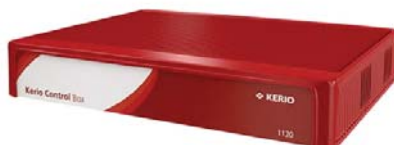
KERIO CONTROL BOX 1120